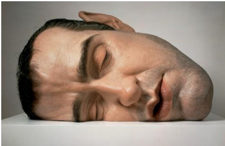
Mask II, 2001-2002, matériaux divers, Ron Mueck