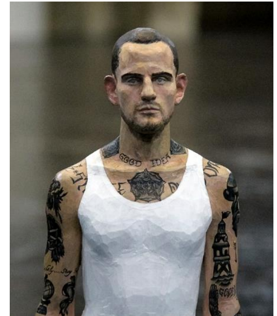
Adam, 2012, bois de tilleul, Tomoaki Suzuki

La mise en couleur à la gouache a permis de mettre en valeur le travail du modelage (ou au contraire de tout gâcher... pas facile de trouver la bonne teinte pour la peau !)