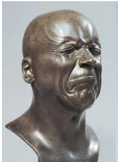
Tête de caractère, Le dégoût, vers 1780, étain. Franz Xavier Messerschmidt